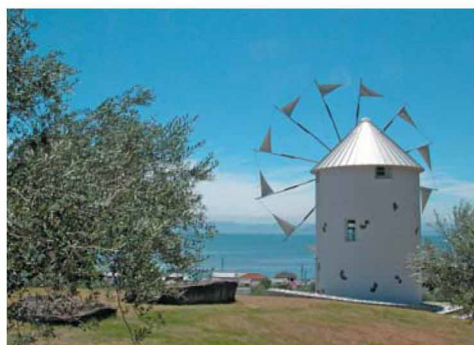
青い瀬戸の海を見渡せ、園内では50種類、2000本のオリーブが植栽されており、日本ではここにしかないオリーブの木もある。