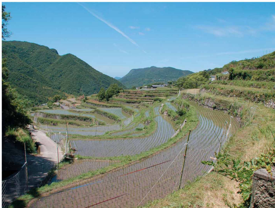
田植えが終わってすぐの中山千枚田。季節によって色んな表情を見せ、訪れる人を楽しませてくれる。