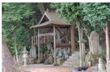
日本名水百選に選ばれた湯船の水。山腹から湧き出る水は、干ばつの時にも枯れることがないといわれている。