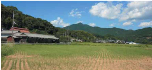
穏やかな里山の田園風景は、いにしへの荘園時代の情景を感じさせる。

愛媛県の最南端に位置する愛南町は、リアス式海岸の豊かな内海と黒潮が還流する外海、そして穏やかな里山の自然に恵まれた別天地。古くは京都の青蓮院門跡の荘園「観自在寺荘」として発展し、今なお自然豊かな荘園の風情を残している。 四国の水揚げを誇るカツオをはじめ、ブリ・タイ・カキなどの海の幸と、日本一の生産量を誇る愛南ゴールド（河内晩柑）などの山の恵み。豊かな自然がもたらす上質な季節の幸と、お遍路さんへの「お接待」で培った温かい人情が町の自慢。