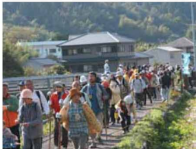
毎年11月開催のへんろ道を歩くイベント「トレッキング・ザ・空海あいなん」では、道中各所に小中学生や婦人会など地元住民による「お接待」が行われ好評を得ている。