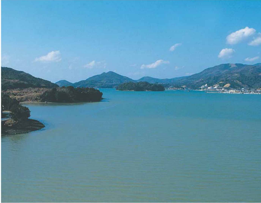
リアス式海岸の豊かな内海・御荘湾は、僧都川をはじめ5つの川から山の栄養分が流れ込み、餌となるプランクトンが豊富に生息している。穏やかな湾内では、タイヤスズキ、クエ、カキ、ヒオウギ貝、真珠貝などの養殖が盛んに行われている。