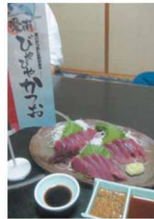
四国一のカツオの水揚げを誇る深浦漁港でしかあがない「愛南びやびやかつお」は、鮮度が高く身が引き締まり、もちもちした食感が味わえる幻のカツオ。

四国霊場四十番札所観自在寺を中心にまちを横断するへんろ道があり、へんろ道沿いでは、昔からお遍路さんに対して「お接待」が行われていた。現在でも案内板や休憩所・トイレなどお遍路さんが歩きやすいように整備している。