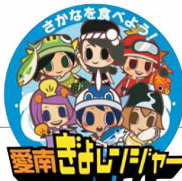
ぎょしょく普及戦隊愛南ぎょレンジャー