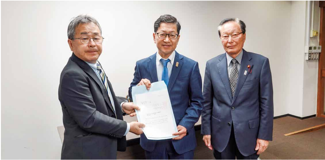
要望活動の様子(左から池田町村会長、濱田知事、中城町村議会議長会長)

令和5年4月17日、池田三男 高知県町村会長及び中城重則 高知県町村議会議長会長は、去る令和5年2月20日開催の「高知県町村長・町村議会議長大会」において満場一致で可決した「脱炭素社会の実現」ほか5項目の決議及び「地方創生の更なる推進に向けての特別決議」ほか2項目の特別決議の実現に向け、濱田省司 高知県知事をはじめ、所管部長に対して要望活動を行った。