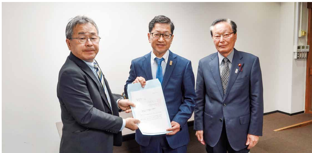
要望活動の様子(左から池田町村会長、濱田知事、中城町村議会議長会長)

令和5年4月17日、池田三男 高知県町村会長及び中城重則 高知県町村議会議長会長は、去る令和5年2月20日開催の「高知県町村長・町村議会議長大会」において満場一致で可決した「脱炭素社会の実現」ほか5項目の決議及び「地方創生の更なる推進に向けての特別決議」ほか2項目の特別決議の実現に向け、濱田省司 高知県知事をはじめ、所管部長に対して要望活動を行った。