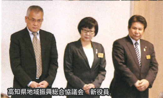
高知県地域振興総合協議会 新役員