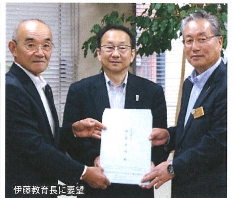
伊藤教育長に要望