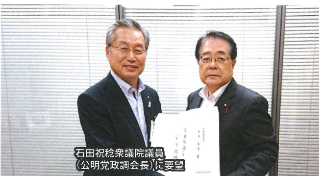
石田祝稔衆議院議員(公明党政調会長)に要望