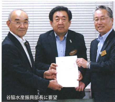
谷脇水産振興部長に要望