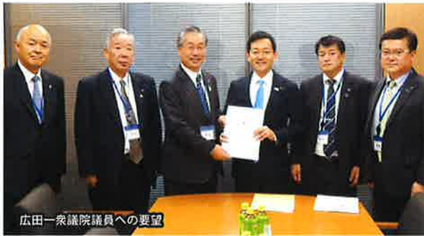
広田一衆議院議員への要望

その後、本会では、県選出国会委員(衆議院6名・参議院3名)に対し、要望活動を実行し、同大会で決定された要望事項の他、ダム・発電関係市町村協議会要望事項など、本県町村に関係する様々な課題について、町村の現状を説明するとともに、その解決について要望を行った。