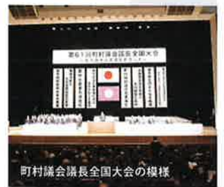
町村議会議長全国大会の様相

また、大会前日には、当会主催の「高知県選出国会議員と県内町村議会議長との意見交換会」の場において、「平成30年度税制改正に関する要望」について、高知県選出国会議員に対して、県内町村議会議長の総意として、この実現方の特段のご高配をお願いした。