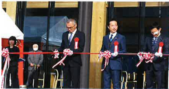
仁淀川町役場新庁舎落成セレモニー