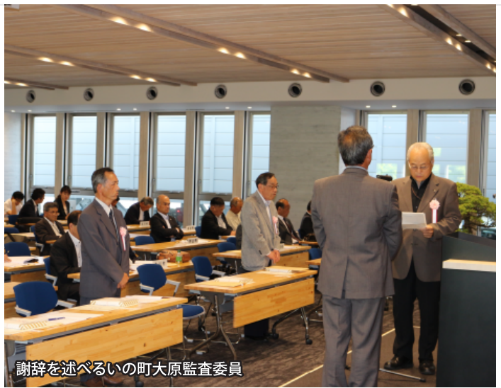
謝辞を述べるいの町大原監査委員