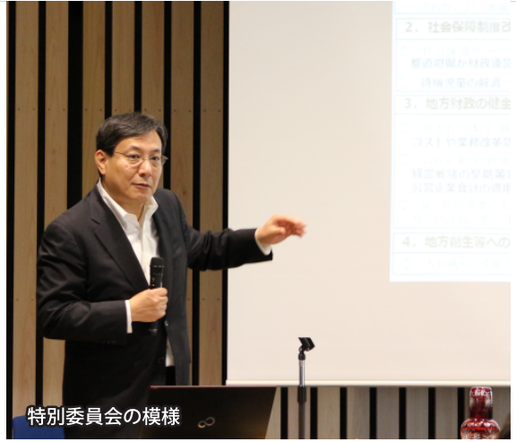
特別委員会の模様

講演では、県、市町村の今後の財政運営について、多くのご示唆をいただいた他、大変参考となる情報をお聞かせいただき、参加者からは、「大変分かりやすくお話いただいた。」「自らが制度を理解し、国の動きや将来の見通しなどを、自身で良く考えることが大切だと感じた。」など大変好評をいただいた。