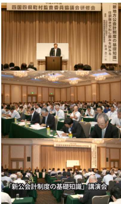
「新公会計制度の基礎知識」講演会