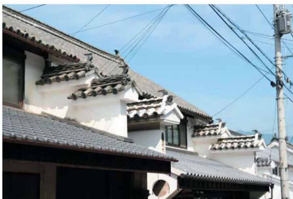
全国的にも珍しい二層うだつの町並み

つるぎ町は、剣山などの山々に囲まれた巨樹の里。日本一の赤羽根大師のエノキ(国指定天然記念物)をはじめ、四国一の奥大野のアカマツ・桑平のトチノキなど、百本近く巨樹が地域住民の温かな手によって残されている。また、土釜・鳴滝といった名瀑も見応えがある。特に、鳴滝は三段に連なつて流れ落ちる落差85mの県下一の高さを誇る。