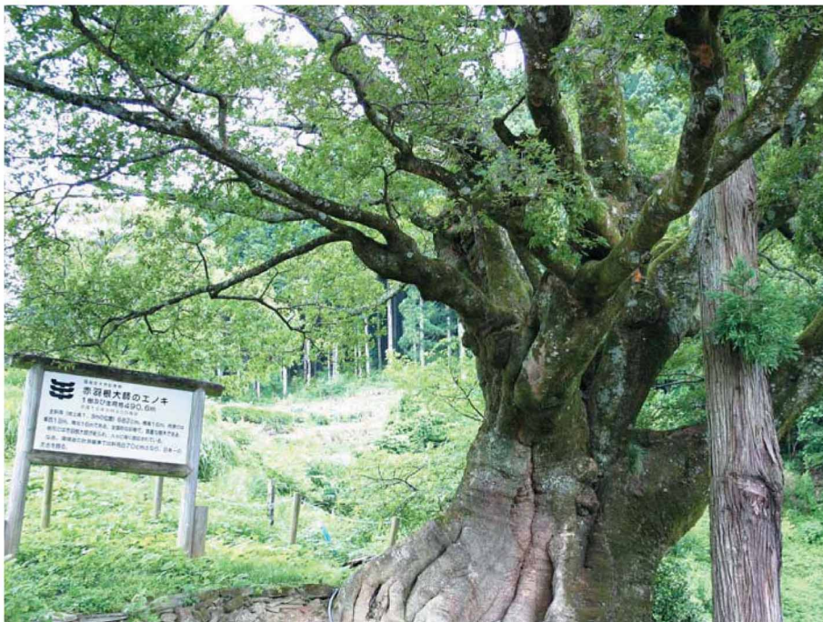
日本一の赤羽根大師のエノキ(国指定天然記念物)