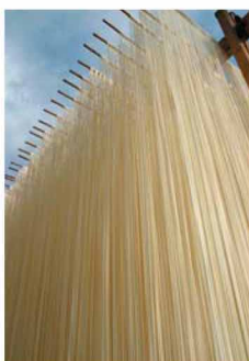
半田そうめんの庭干し

つるぎ町を代表する地域産業のひとつ、江戸時代からの歴史を有する半田そうめんは、やや太めでコシが強いことで知られ、阿波の特産品として全国的にも有名。秋祭りが終わってしばらくすると、そうめんの庭干し(かどぼし)の風景がここかしこに見られ、冬の訪れを告げる風物詩となっている。