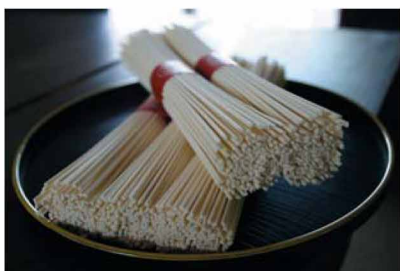
やや太めでコシが強い、半田そうめん