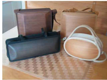
安田川の河原の石や間伐材の切り株をモチーフにした「monacca」バッグ。

【柚】(そま)杉の間伐材から生まれた「新しい木のカタチ」。角材を薄くスライスし、独自の工法により、バッグ、うちわ、ストラップなど、自然を守る気持ちが入められた商品を開発した。 【ゆず】昭和63年に馬路村公認飲料として誕生した、ゆずとはちみつドリンク「ごっくん馬路村」やぼん酢しよゆは、全国にリピーターをもつ。 【交流】バラ風呂、湯けむりピンポン大会などを企画し、おもてなしとあたたかい交流を大切にする「うまじ温泉」。自慢の湯と地の素材を生かしたお料理で、ゆっくり、のんびりできる。