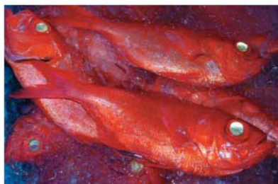
奈半利町一押しの特産品「キンメダイ」。ふるさと納税贈呈品としても注文殺到中。

古くから土佐と都を結ぶ海路の要衝として栄えた奈半利町の「押しの特産品は、「キンメダイ」。黒潮踊る太平洋の恵みを存分に受けた魚の味は絶品。