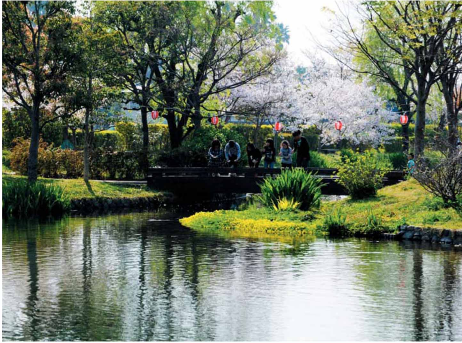
重信川の伏流水で形成された「ひよこたん池」公園。 松前町は、このような親水空間を誰もが安全に利用できる憩いの空間として整備している。

上／有明公園の川岸には家ごとに、かつての洗い場(くみじ)が残り、当時の生活様式を物語る。 下／大型ショッピングセンター「エミフルMASAKI」は松前町の中の新しい「MASAKI」づくりを目指す、地域の交流の場。